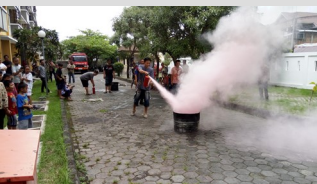
PELATIHAN DARI BPBD