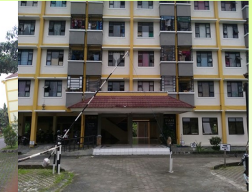
RUSUNAWA PROJOTAMANSARI II