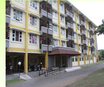
RUSUNAWA PROJOTAMANSARI I