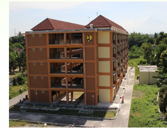
RUSUNAWA PROJOTAMANSARI III