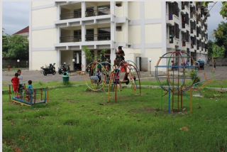
TAMAN BERMAIN ANAK