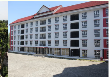
RUSUNAWA PROJOTAMANSARI IV