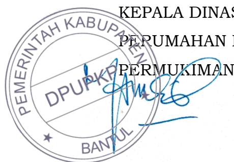
KEPALA DINAS PEKERJAAN UMUM PERUMAHAN DAN KAWASAN PERMUKIMAN

Renja Perangkat Daerah Tahun 2026 akan menjadi pedoman Perangkat Daerah dalam menyusun RKA Perangkat Daerah Tahun 2026. Selain itu, Renja Perangkat Daerah Tahun 2026 akan menjadi dasar evaluasi hasil rencana pembangunan tahunan daerah untuk periode Tahun 2026. Evaluasi terhadap hasil Renja Perangkat Daerah Tahun 2026 dilakukan setiap triwulan dalam tahun berkenaan. Dalam hal hasil evaluasi tersebut ditemukan adanya ketidaksesuaian dengan perkembangan keadaan, meliputi perkembangan yang tidak sesuai dengan asumsi kerangka ekonomi dan keuangan daerah yang digunakan serta adanya keadaan yang menyebabkan saldo anggaran lebih anggaran sebelumnya harus digunakan untuk tahun berjalan, dapat dilakukan penyesuaian.