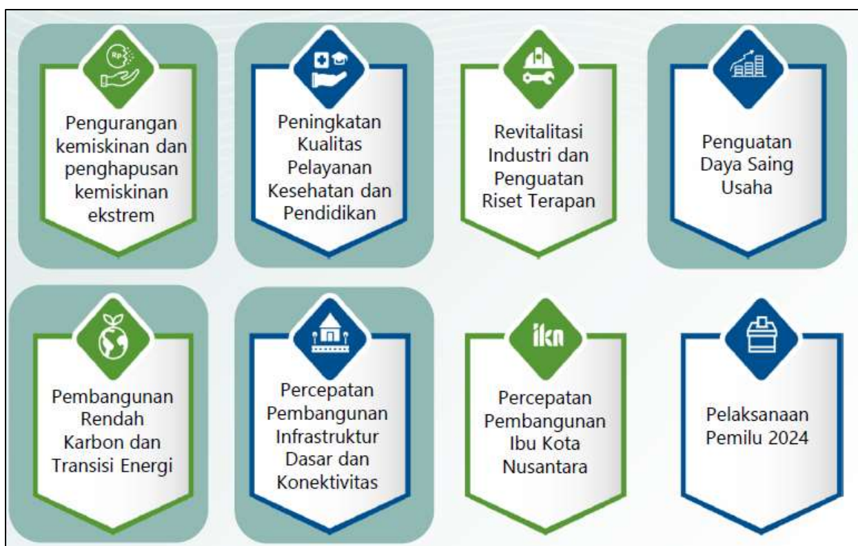
Gambar 3.1 Arah Kebijakan RKP Tahun 2024

Pada Tahun 2024, Tema Pembangunan Nasional yang ditetapkan dalam RKP Tahun 2024 adalah "Mempercepat Transformasi Ekonomi yang Inklusif dan Berkelanjutan" dengan 8 arah kebijakan sebagai berikut: